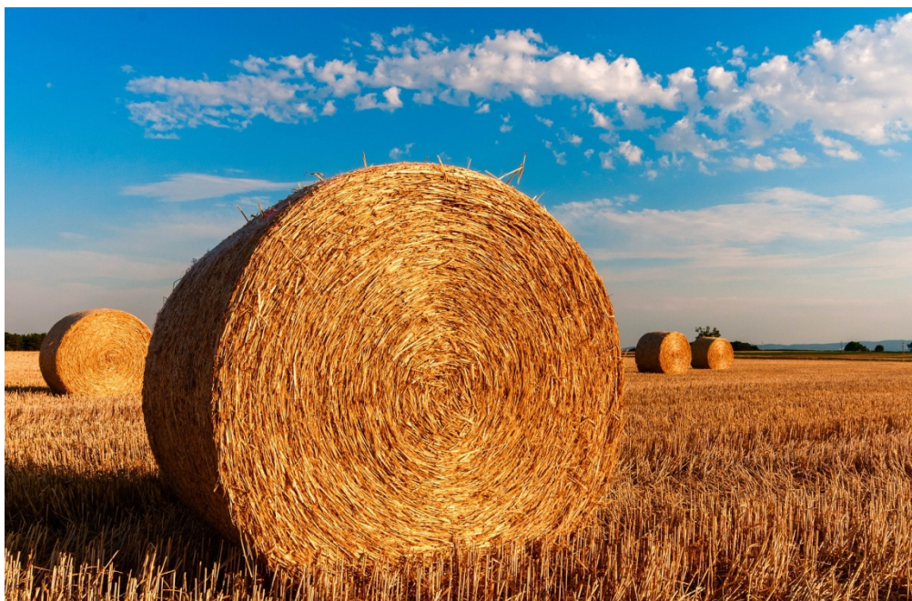
Tekst en beeld: Freddy Danau

Beetje moeilijk? Nou moe... De zee trekt zich ook terug, af en toe!